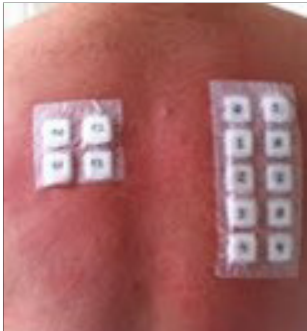
Figura 1. Testes cutâneos com série básica dermatite de contacto

ma e à implantação, alguns dias depois, de novo sistema CRT-D (Protecta XT CRT-D; Medtronic), a nível peitoral direito, subcutâneo. Quatro meses após, recorre novamente ao hospital, sendo internado com quadro clínico sobreponível ao anterior. Foi igualmente excluído quadro infeccioso, sendo o doente submetido a uma segunda explantação e reposicionamento submuscular direito. Oito meses após o procedimento, o doente refere reinício de novo quadro caracterizado por eritema doloroso, prurido, edema flutuante e exsudado confinados ao local do implante. Foi solicitado o apoio do Serviço de Imunoalergologia por suspeita de quadro alérgico. Realizaram-se testes epicutâneos com a série standard europeia para dermatite de contacto, incluindo alergénios como cobalto, níquel, e epóxi e os resultados foram negativos (Figura 1). Foi contactado o fabricante da marca do CRT-D e solicitado kit com materiais presentes no gerador e elétrodos para realização de testes epicutâneos, incluindo titânio revestido com parileno, borracha de silicone, “polissulfone” e poliuretano. Os