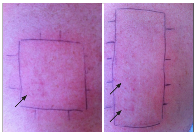
Figura 3. Testes epicutâneos com kit fornecido pelo fabricante, às 96 horas. Silicone MDX 70, 50 ETR silicone e silicone Med 4719 ligeiramente positivos