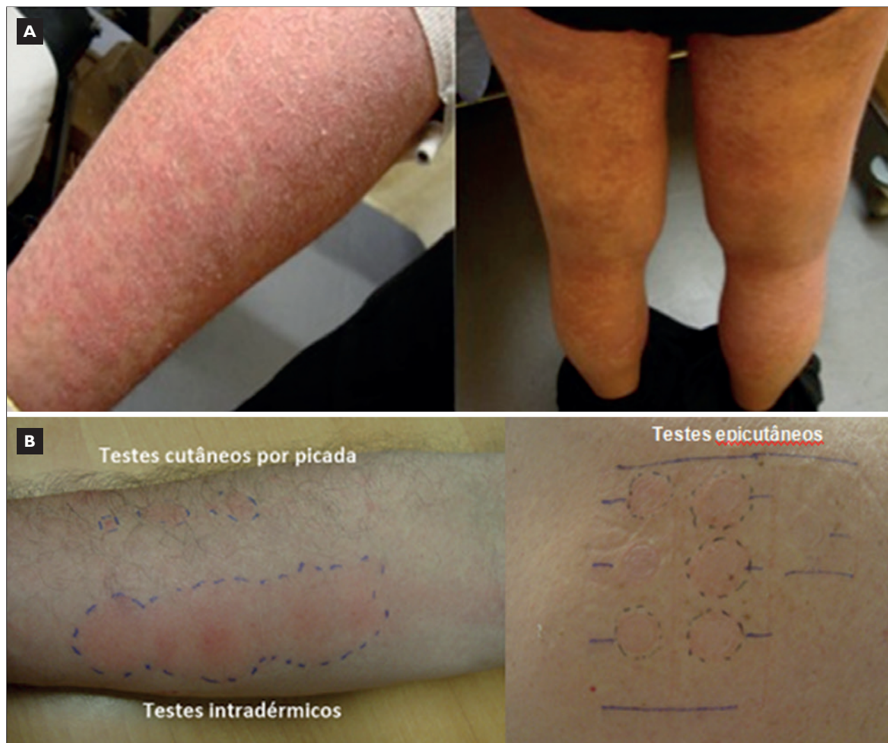
A – Lesões cutâneas apresentadas pelo doente; B – Resultados da leitura às 48 horas dos testes cutâneos aos meios de contraste iodado.